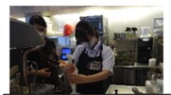
コーヒーショップ