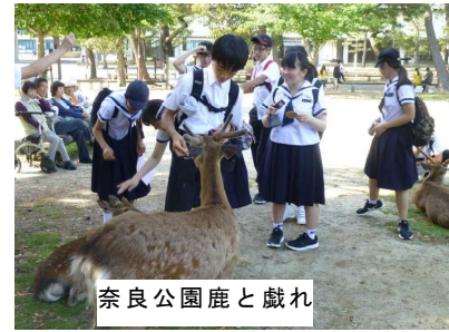
奈良公園鹿と戯れ