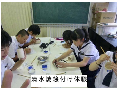
清水焼絵付け体験