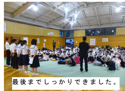
最後までしっかりできました。