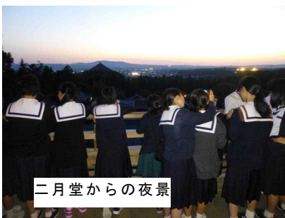
二月堂からの夜景