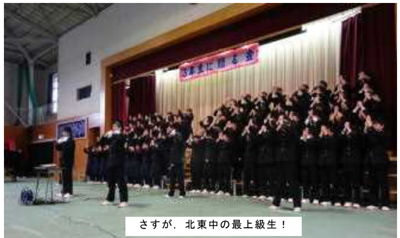
さすが、北東中の最上級生！