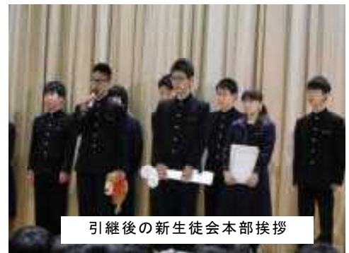
引継後の生徒会本部挨拶