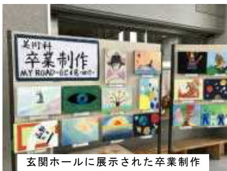
玄関ホールに展示された卒業制作