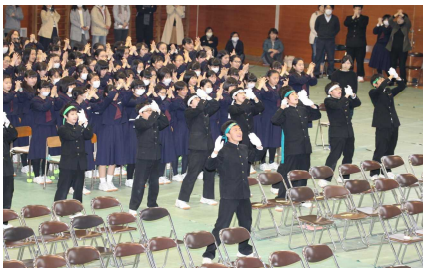
1・2年生の3年生への応援