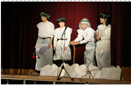
オープニングのひとこま