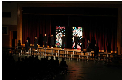
エンディングの様子