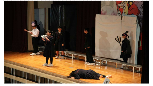
3年生の思い出の場面を寸劇に