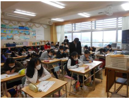
真剣に考える数学の授業

そして、数学は考え方や説明を重視した授業でしたが、児童の感想には、「出前授業すっごく楽しかったです。もしお世話になったらその時はよろしくお願いします」とプリントにコメントを寄せてくれた児童もいました。授業への意欲を持たせ、課題を克服していけるよう、私達も「わかる授業」に一生懸命取り組んでいきたいと思ひます。