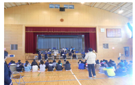
アンコールに応える吹奏楽部

本番、演奏面では少し未完成な部分もありましたが、私達なりの音に心をこめて届けられたらと思ひました。小学生のみなさんが、一緒に歌ってくれたり、話を聞いて笑ってくれたりして、発表している私達もとても楽しくて元気をもらいました。これからも吹奏楽部の魅力をいろいろな方に知っていただけるように頑張っていきたいです。～