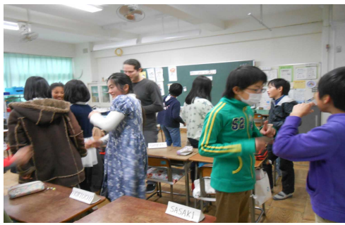
英語で交流する児童 明るいです