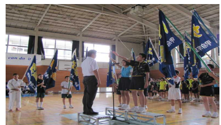
総合体育大会迫る