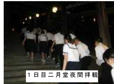
1日目二月堂夜間拝観