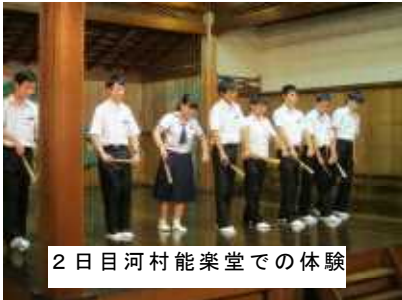
2日目河村能楽堂での体験