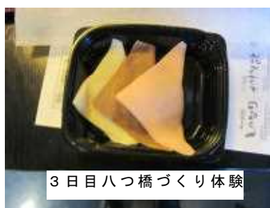
3日目八つ橋づくり体験